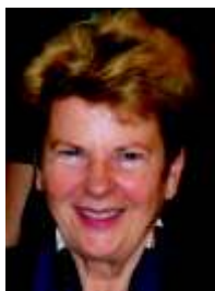
Waltraud KLASNIC Präsidentin