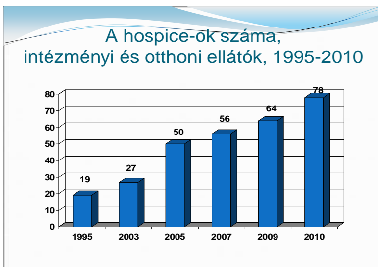
1. ábra: A hospice-ok száma, intézményi és otthoni ellátók, 1995-2010

A hospice szervezetek megoszlása 2010-ben a következő volt: